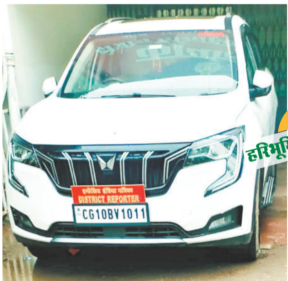
आरटीओ कार्यालय में खड़ी निजी कार।