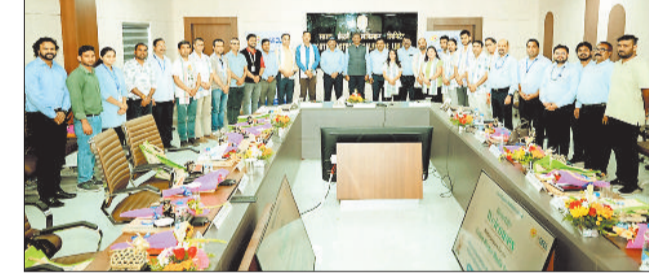
भ्रमण के दौरान एसडीएसएल अफसरों से मिला प्रतिनिधिमंडल।

बिलासपुर। सूचना एवं प्रसारण मंत्रालय, भारत सरकार के पत्र सूचना कार्यालय (पीआईबी) सिक्किम एवं छत्तीसगढ़ के संयुक्त तत्वावधान में सिक्किम से 15-सदस्यीय मीडिया प्रतिनिधिमंडल ने 10 फरवरी को कोयला खदान गेवरा का दौरा किया।